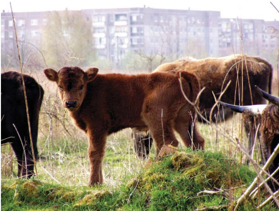
(Blick in Richtung Waldkerbelstraße.jpg) Grünflächenamt