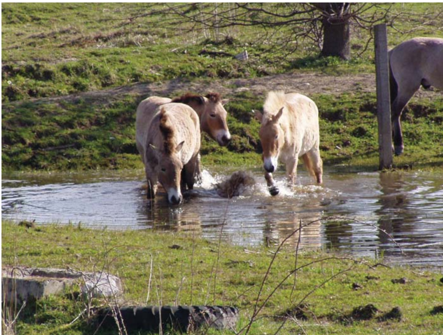
(Rast mit Blick in Richtung Waldkerbelstraße.jpg) Grünflächenamt