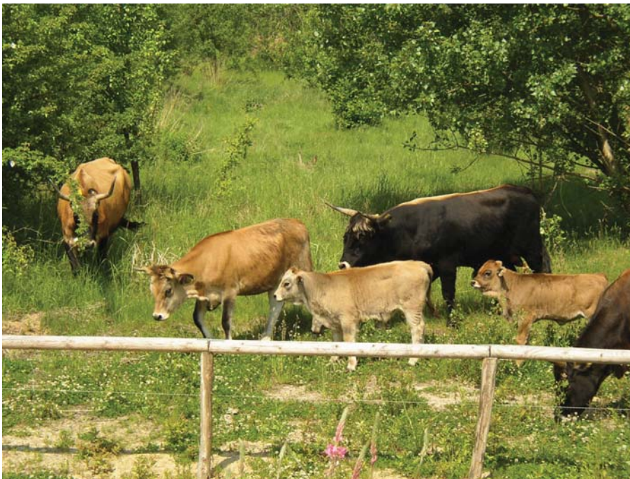
(Foto_6 Heckrinder.jpg) Grünflächenamt