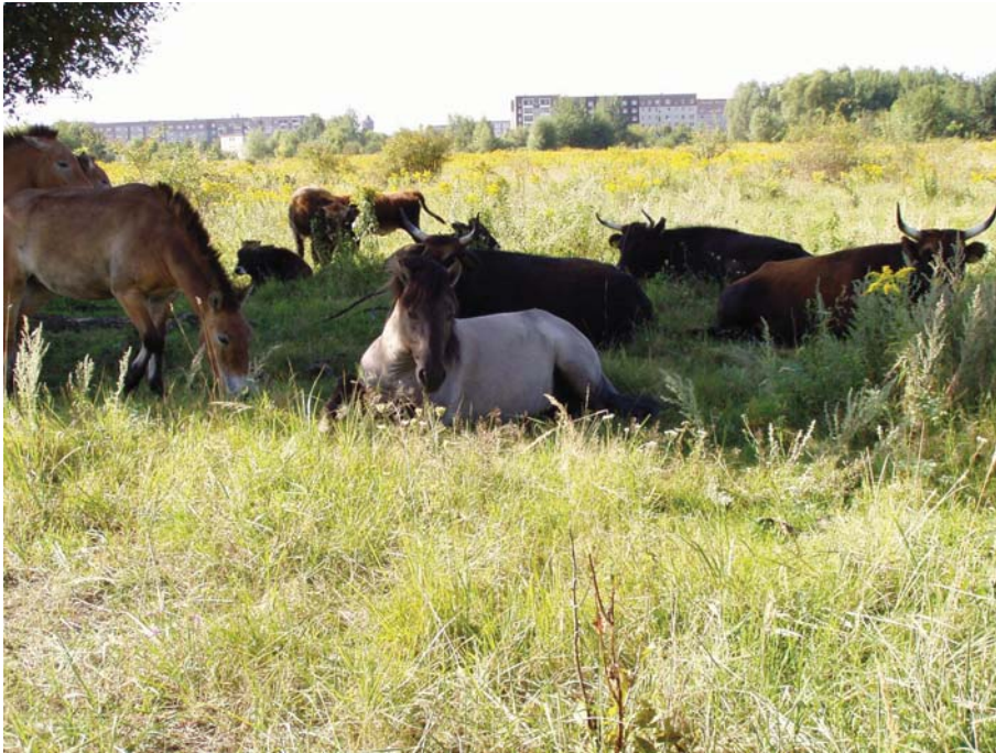
(Rast mit Blick in Richtung Waldkerbelstraße.jpg) Grünflächenamt