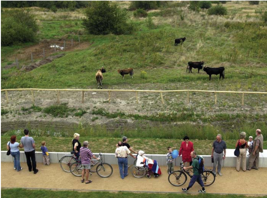
(Grüner Bogen Paunsdorf 01-1.jpg) Kemptner

Herbst 2004: Die ersten Tiere kommen - Heckrinder